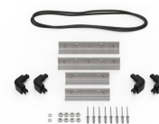
iM20XX-M4-BEZEL Bisel de la base (métrico)