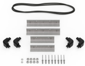
iM20XX-BEZEL Kit de bisel para base