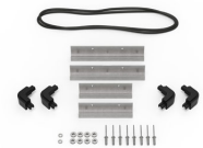
iM20XX-M4-BEZEL Bisel de la base (métrico)