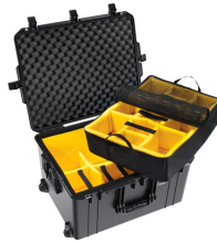
1637WD With Padded Dividers