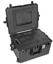
WINE-12B 12-Bottle Wine