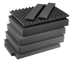
1637AirFS Juego de 7 piezas de espuma de recambio