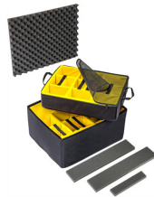
1637AirDS Divisores acolchados