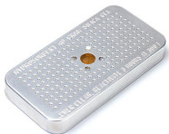
1500D Gel di silice essiccante