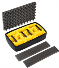
1535AirDS Set di divisori imbottiti