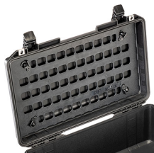
1535MP EZ-Click™ MOLLE Panel