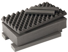
1535AirFS 3 pz. set ricambio schiuma