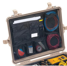
1609 Coperchio organizer