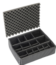
1605 Set di divisori imbottiti