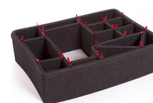
1550EUTP Kit divisorio per valigie TrekPak