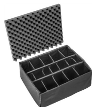
1615 Set di divisori imbottiti