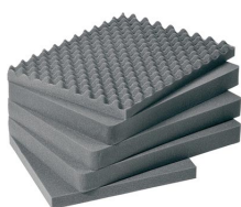
1611 5 pz. set ricambio schiuma