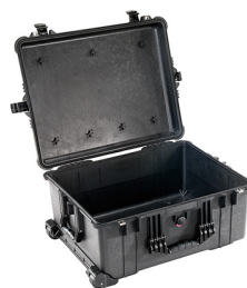
1610NF No Foam