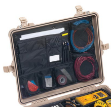
1609 Coperchio organizer