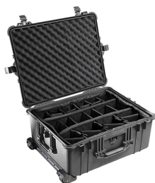
1614 With Padded Dividers