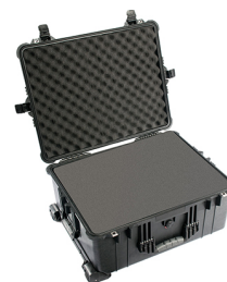
1610WF With Foam