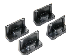
1507 Supporti veloci - set di 4