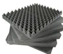
0551 6 pz. set ricambio schiuma