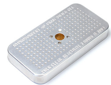
1500D Gel di silice essiccante