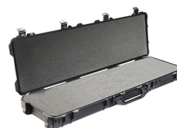
1750WF With Foam