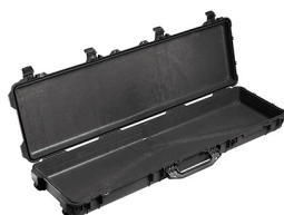
1750NF No Foam