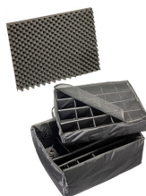
1695 Set di divisori imbottiti