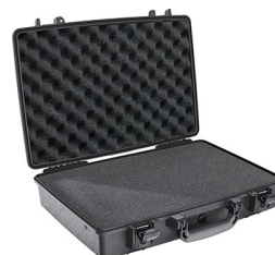
1490WF With Foam