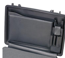
1498 Computer Lid Organizer