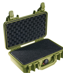
1170WF With Foam