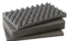
1171 3 pz. set ricambio schiuma