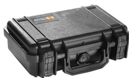
1170NF No Foam