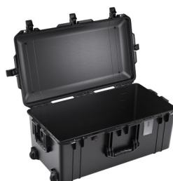
1626NF No Foam