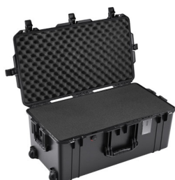
1626WF With Foam