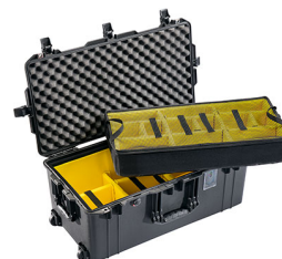
1626WD With Padded Dividers