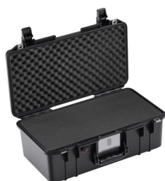
1506WF With Foam