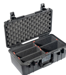
1506TP With TrekPak Divider System