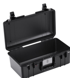
1506NF No Foam