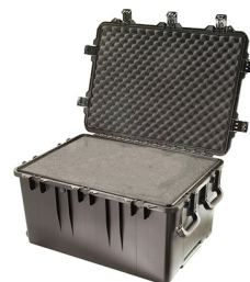
iM3075-X0001 With Foam