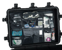
iM3075-UTILITYORG Organizer accessori