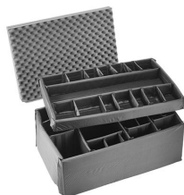
iM3075-DIV Set di divisori imbottiti