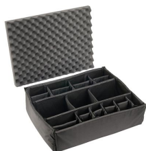
iM2700-DIV Set di divisori imbottiti