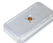
1500D Gel di silice essiccante