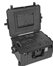
WINE-12B 12-Bottle Wine