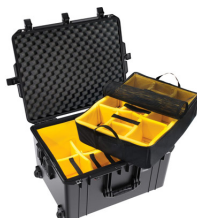
1637WD With Padded Dividers