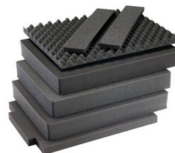
1637AirFS 7 pz. set ricambio schiuma