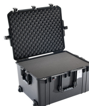
1637WF With Foam