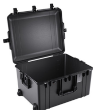
1637NF No Foam