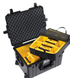
1607WD With Padded Dividers