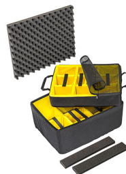
1607AirDS Set di divisori imbottiti