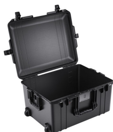
1607NF No Foam