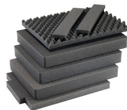
1607AirFS 3 pz. set ricambio schiuma