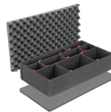
1555TPKIT Kit de séparation de la valise TrekPak