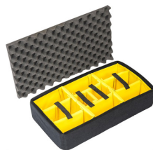
1555AirDS Cloison en mousse