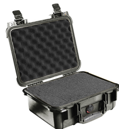
1400WF With Foam