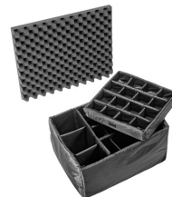
1625 Cloison en mousse