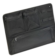
1569 Pochette couvercle