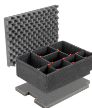
1560TPKIT Kit de séparation de la valise TrekPak