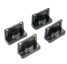
1507 Supports rapides - jeu de 4