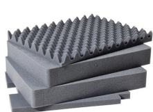
1561 Jeu de mousses de rechange, 4 pièces