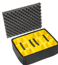
1565 Cloison en mousse