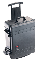
1560MWF With Foam