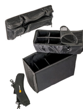
1435 Cloison en mousse