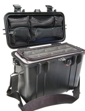
1434 With Padded Dividers & Lid Organizer