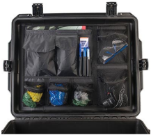
iM27XX-UTILITYORG Pochette utilitaire