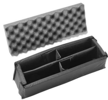
iM2306-DIV Cloison en mousse