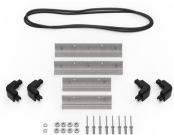
iM20XX-M4-BEZEL Lunette de base (métrique)