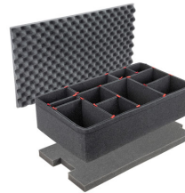
1615TPKIT Kit de séparation de la valise TrekPak