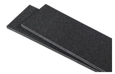
1615TPDIV Séparateurs TrekPak supplémentaires