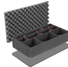
1555TPKIT TrekPak Koffer Teiler Kit