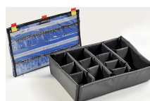
1505EMS EMS Accessory Set (Lid Organizer and Divider Set)