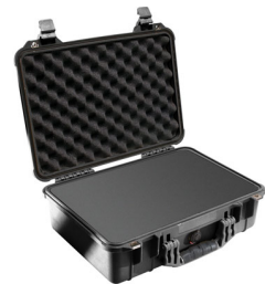
1500WF With Foam