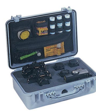
1508 Deckeleinteiler für Fotografen