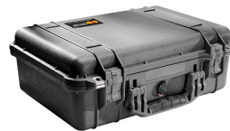
1500NF No Foam