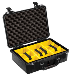
1504 With Padded Dividers