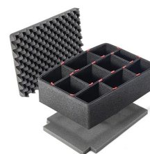
1500TPKIT TrekPak Koffer Teiler Kit