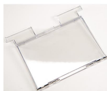
1630DC Dokumentenbehälter Zubehör