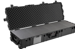
1770WF With Foam