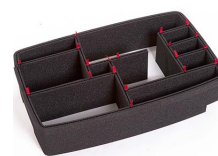
1510EUTP TrekPak Koffer Teiler Kit