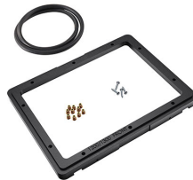
1200PF Panelrahmen für Spezialanwendungen