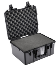
1507WF With Foam