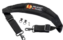
iM-STRAP-S-VER2 Padded Shoulder Strap