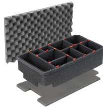
1535TPKIT Kit de séparation de la valise TrekPak