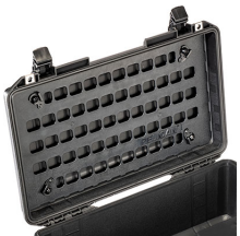
1535MP EZ-Click™ MOLLE Panel