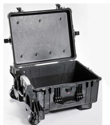
1610MNF No Foam