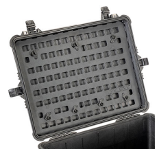
1610MP EZ-Click™ MOLLE Panel