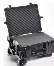
1610MWF With Foam