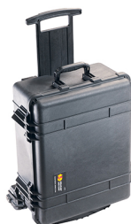
1560MNF No Foam