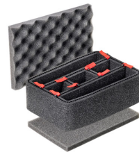
1120TPKIT Kit de séparation de la valise TrekPak