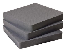
1642 Pick N Pluck; sections seulement (jeu de 3)