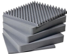
1641 Jeu de mousses de rechange, 5 pièces