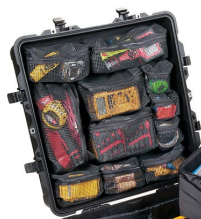
0379 Pochette couvercle