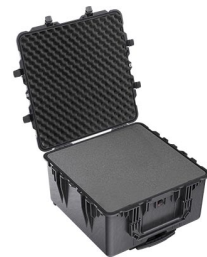
1640WF With Foam