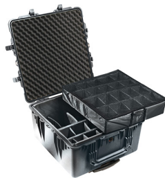
1644 With Padded Dividers