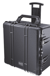
1640NF No Foam