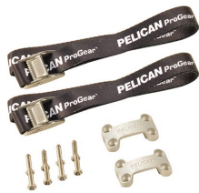
TDKIT Trousse de fixation