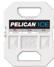
PI-5LB Bloc réfrigérant 5 lb