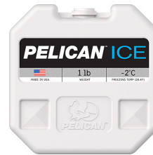
PI-1LB Bloc réfrigérant 1 lb