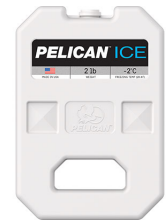
PI-2LB Bloc réfrigérant 2 lb