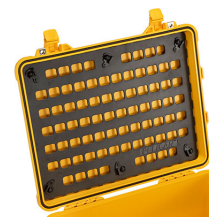
1560MP EZ-Click™ MOLLE Panel