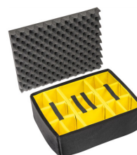
1565 Cloison en mousse