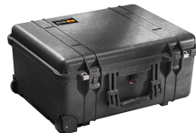
1560NF No Foam