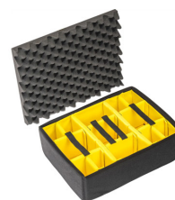
1555 Cloison en mousse