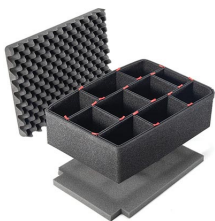
1550TPKIT Kit de séparation de la valise TrekPak