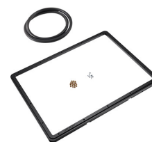
1550PF Cadre de panneau pour application spéciale