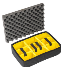
1505 Cloison en mousse