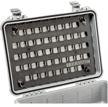
1500MP EZ-Click™ MOLLE Panel