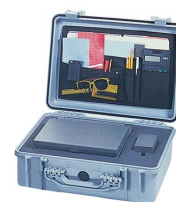
1509 Pochette couvercle