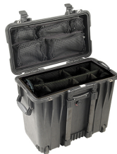
1444 With Utility Padded Divider Set & Lid Organizer