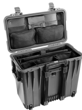
1447 With Padded Office Divider Set & Lid Organizer