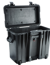
1440NF No Foam