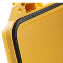
1443 Joint torique de remplacement