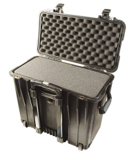
1440WF With Foam