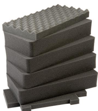
1441 Jeu de mousses de rechange, 6 pièces