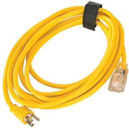
9606 Câble d'alimentation