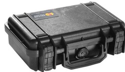
1170NF No Foam