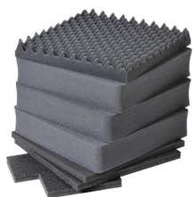
0351 Jeu de mousses de rechange, 7 pièces