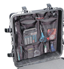
0359 Pochette couvercle