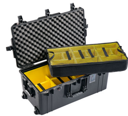
1626WD With Padded Dividers