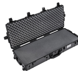
1745WF With Foam